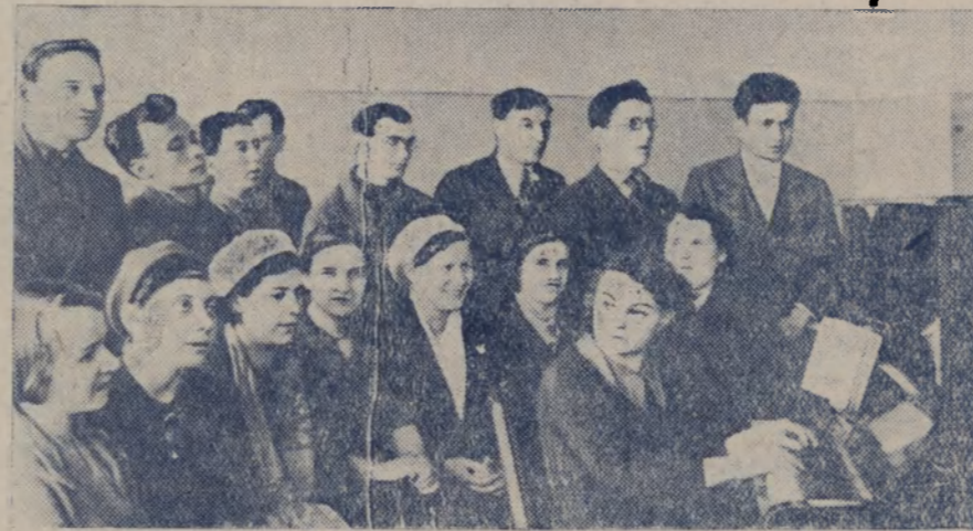
Хор студэнтаў II курса гістфана.